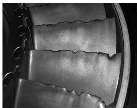
Das kann teuer werden: Triebwerkschaufel mit FOD.

Wer für sein Flugzeug eine Kaskopolice abgeschlossen hat, kann auf eine Entschädigung hoffen. Gemäss den allgemeinen Vertragsbedingungen sind Schäden am Triebwerk gedeckt, die durch das Einsaugen von Fremdkörpern entstehen. Vorausgesetzt wird allerdings, dass das Schadenereignis plötzlich auftritt oder zum sofortigen Stillstand führt. Wenn der Einsaugschaden hingegen nur eine allmähliche Verschlechterung der Beschaffenheit oder der Leistung des Triebwerks bewirkt, ist keine Versicherungsleistung fällig. Bestraft wird auch, wer nachlässig handelt. Ausgeschlossen sind nämlich Schäden, die durch Gegenstände entstanden sind, die im Triebwerk oder im Triebwerkschacht liegen geblieben sind und bei der Vorflugkontrolle hätten entdeckt werden sollen.